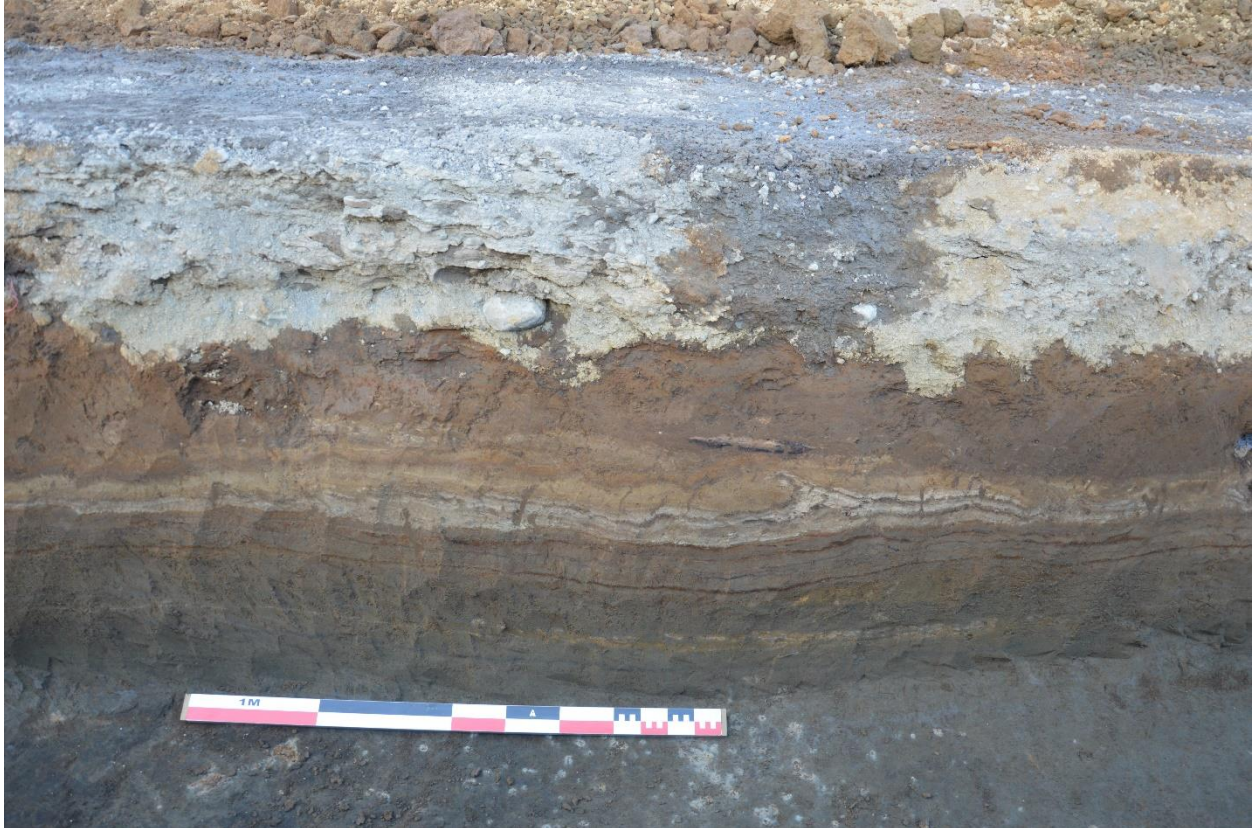
Mynd 2. Skurður 1. Setlög og móöskuflekkir. Horft í norðvestur.

Skurður 1 var 24 m á lengd. Mjög lítil mannvist, einstaka móösku- og kolablettir. Töluverð setlög var að finna í skurðinum sem benda til þess að Brúará hafi reglulega flætt yfir bakka sína þegar hún rann niður Árgil (sjá Mynd 2).