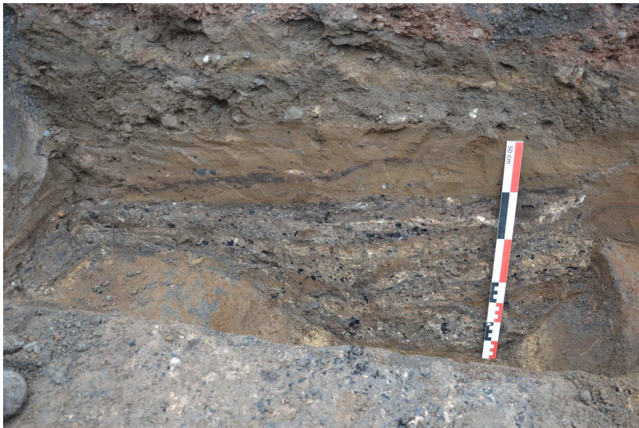
Mynd 10. Skurður 5. Móösku- og kolafyllt ruslagryfja. Horft í suðaustur.

Skurður 5 var 9 m á lengd. Megnið af skurðinum voru langaskurðir frá mismunandi tímum, en í norðaustur enda hans var ruslagryfja. Undir malarplaninu voru nokkur kolablönduð moldarlög, um 35 cm á þykkt, ofan á ruslagryfjunni. Gryfjan var um 50 cm á dýpt, og 1,1 m varðveittir af breidd hennar, en hún var skorin af jarðvegsskiptum undir gangstétt við Garðarsbraut, og því óvíst hver upprunaleg breidd var (sjá Mynd 10). Niðurgröfturinn nær þvert yfir norðausturenda skurðar 5 og því ekki hægt að útiloka að þetta sé í raun skurður en ekki gryfja (sjá Mynd 11). Gryfjan var full af mósku- og viðaröskulögum. Grafinn var um 20 cm breiður skurður ofan í gryfjuna meðfram suðaustur sniðinu til að fá gripni til aldursgreiningar. Bráðabrigðagreining á keramíki, gleri og kítarpípum úr gryfjunni benda til þess að hún sé frá seinni hluta 18. aldar – 19. öld.