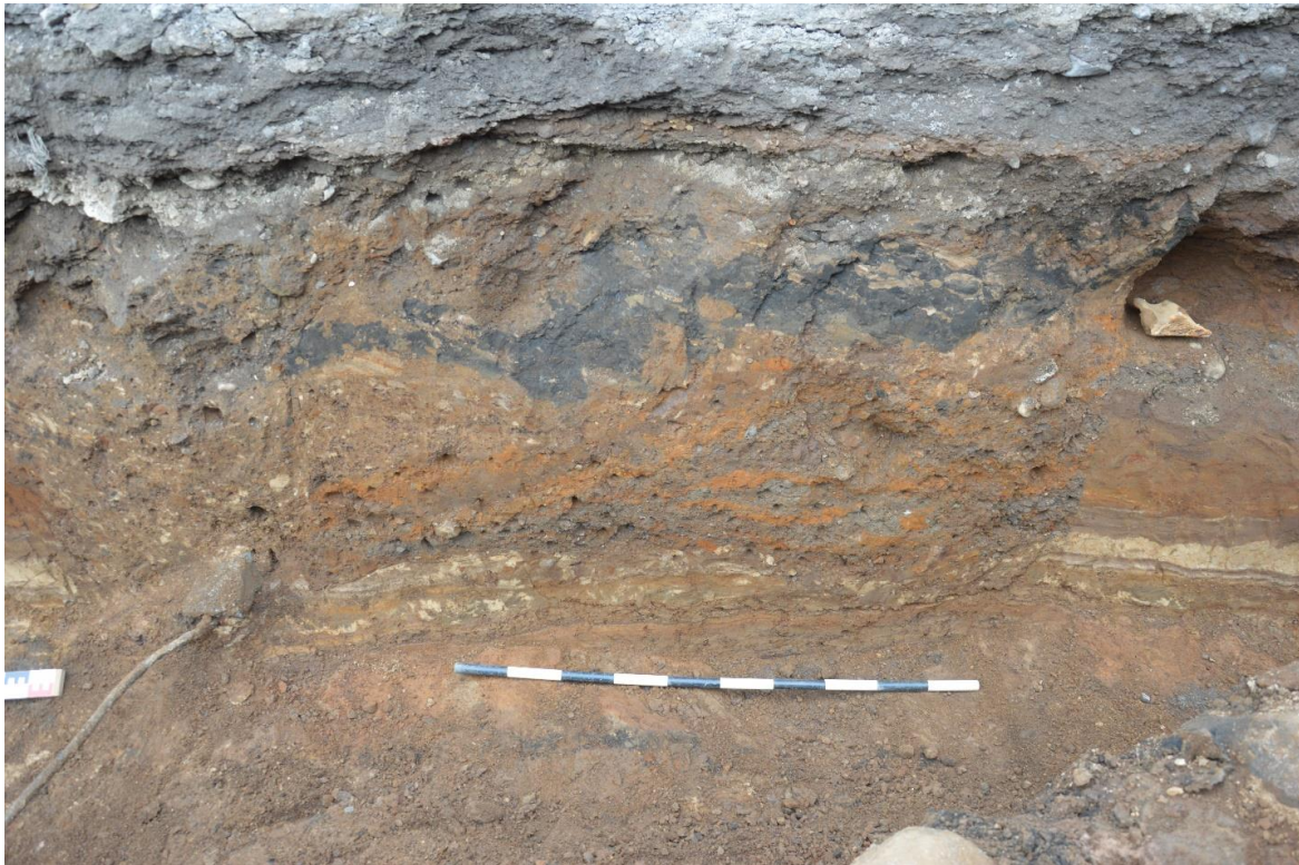
Mynd 14. Skurður 6. Gryfja, óþekkt hlutverk. Horft í norðvestur.