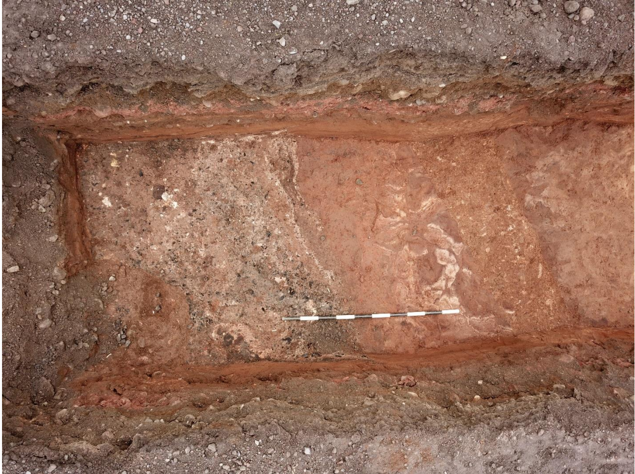
Mynd 11. Skurður 5. Drónamynd af ruslagryfju, vísar í suðaustur.