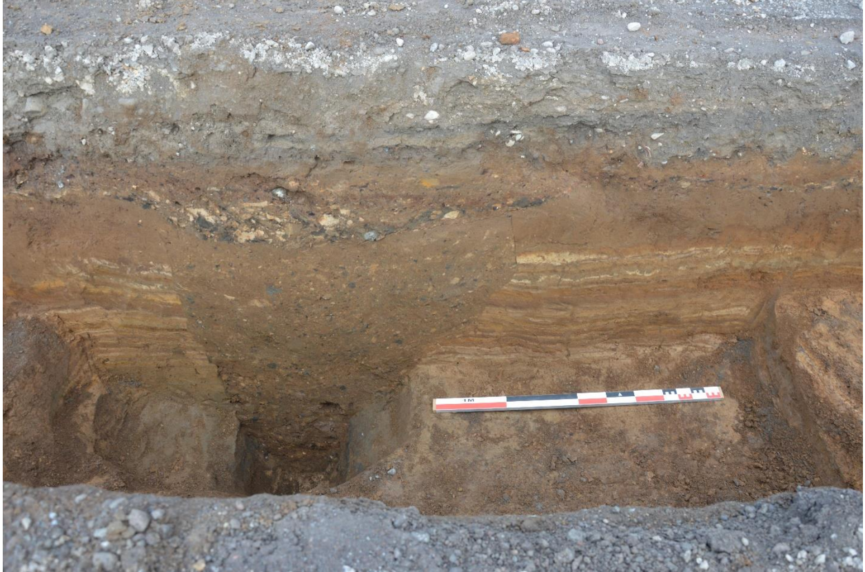
Mynd 3. Skurður 2. Torf- og móöskulög og handgrafin gryfja, óþekkt hlutverk. Horft í norðaustur.