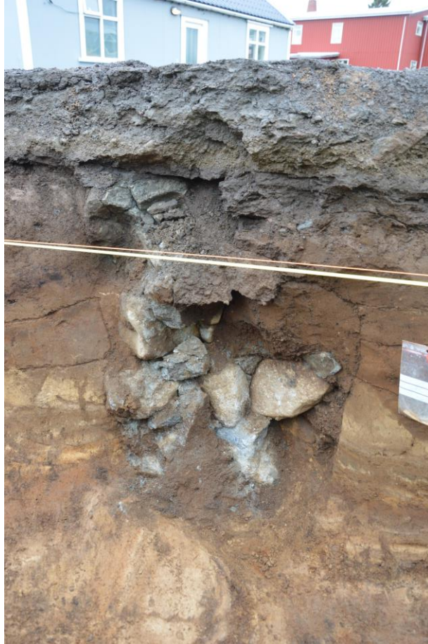
Mynd 4. Skurður 3. Grjót- og steypufyllt gryfja, hugsanlega stoð. Horft í suðvestur.