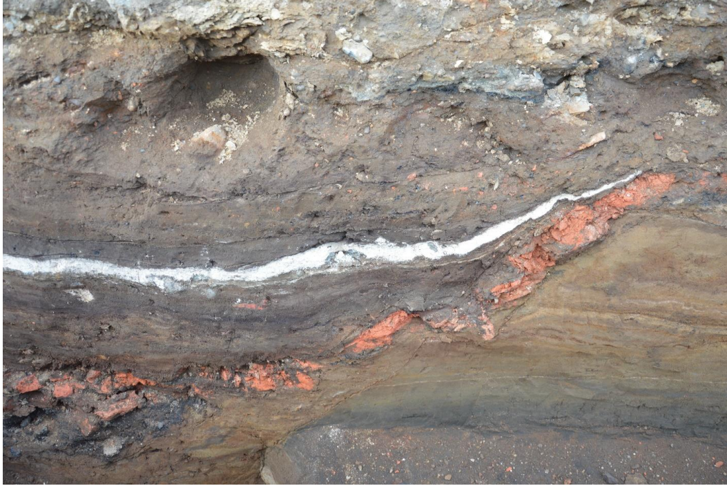
Mynd 8. Skurður 4. Kjallari / gryfja. Múrsteina & brunalög. Horft í norðvestur.