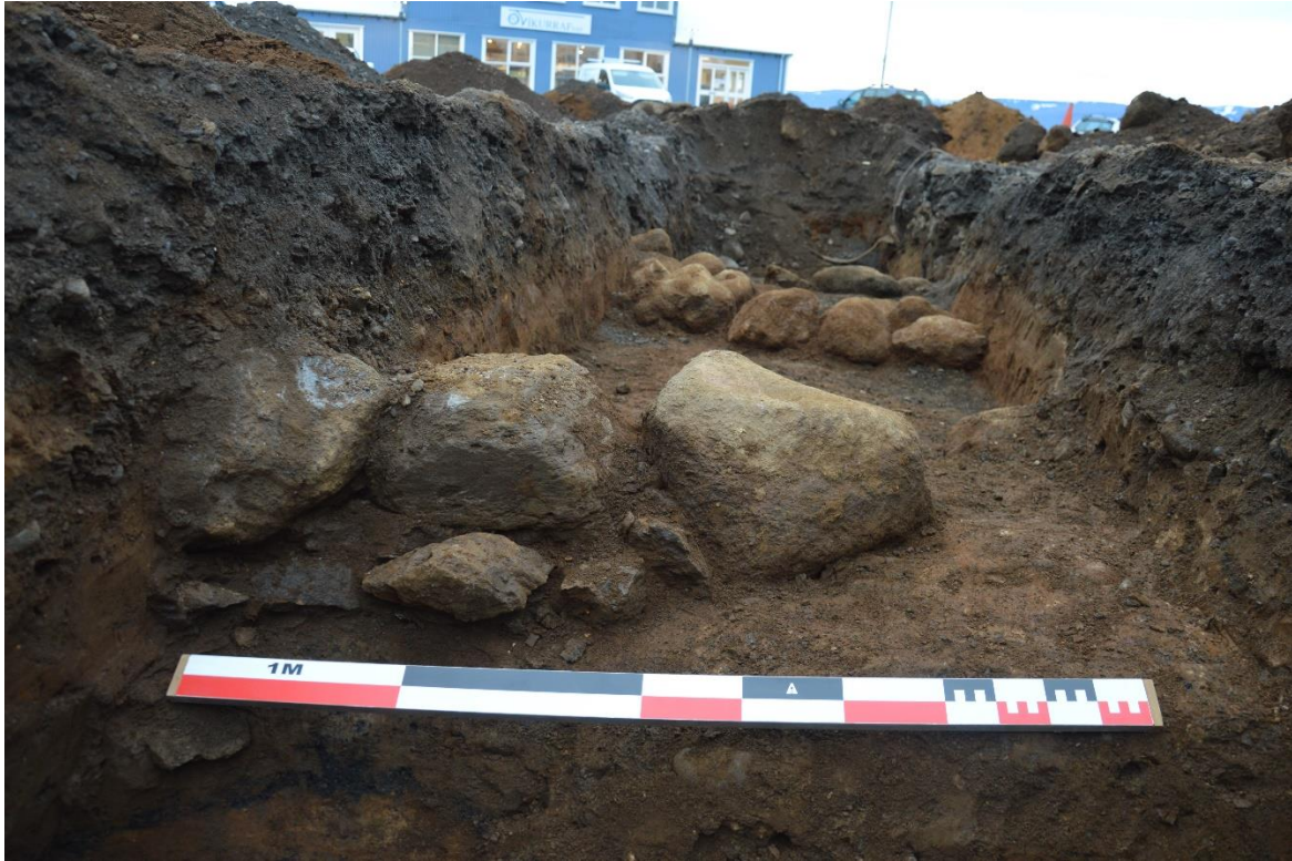
Mynd 13. Skurður 6. Nyrðri hleðsla. Horft í suðvestur.