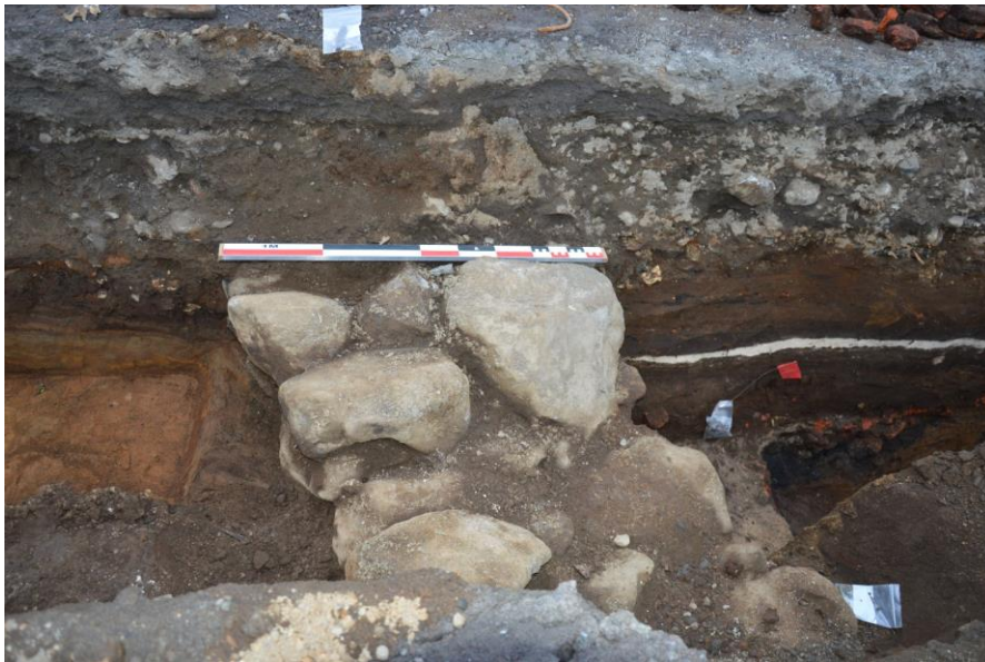
Mynd 6. Skurður 4. Vegghleðsla, horft í norðaustur.

Skurður 4 er á því svæði sem verslunarhús Ørum & Wulff sem brunnu árið 1902 stóðu. 2