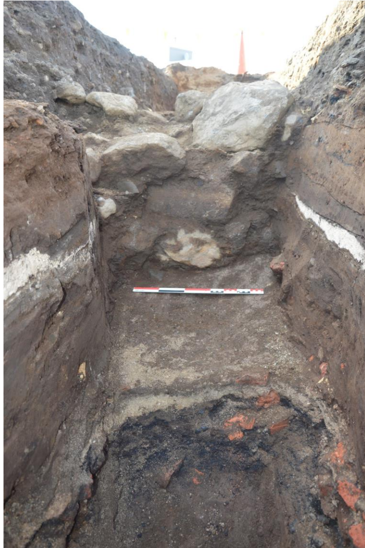
Mynd 7. Skurður 4. Veggheðsla & gryfja/kjallari. Horft í norðvestur.