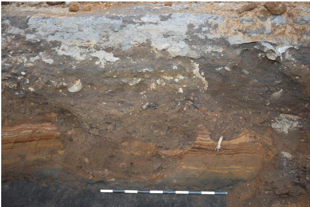
Mynd 9. Skurður 4. Gryfja með uppmokstri & múrsteinum. Horft í norðvestur.