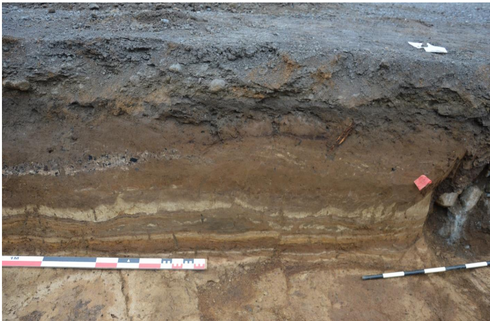
Mynd 5. Skurður 3. Móöskulag og gryfja. Horft í suðvestur.