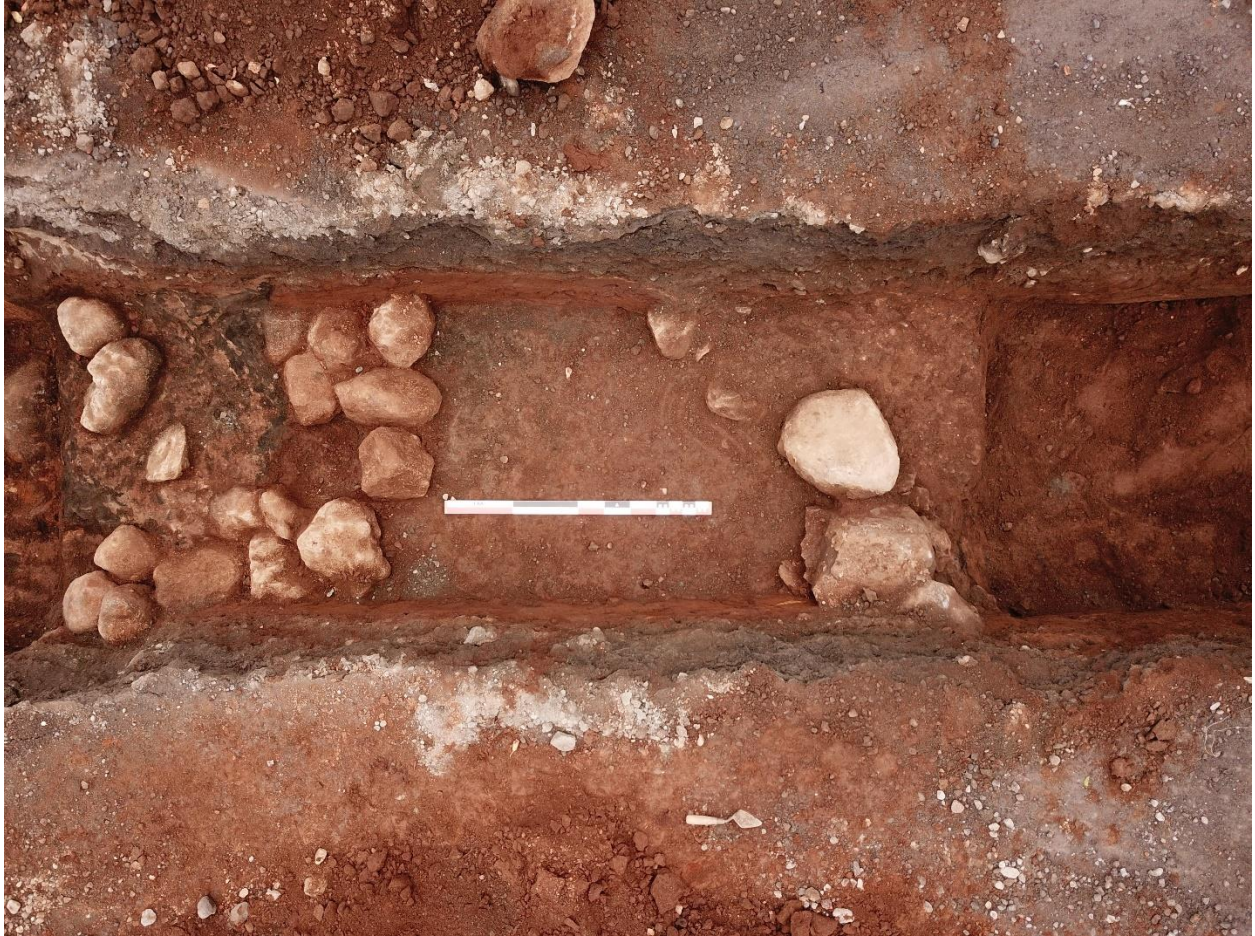
Mynd 12. Skurður 6. Syðri gryfja með grjóthleðslu vinstra megin, nyrðri hleðsla hægra megin. Drónamynd, vísar í norðvestur.